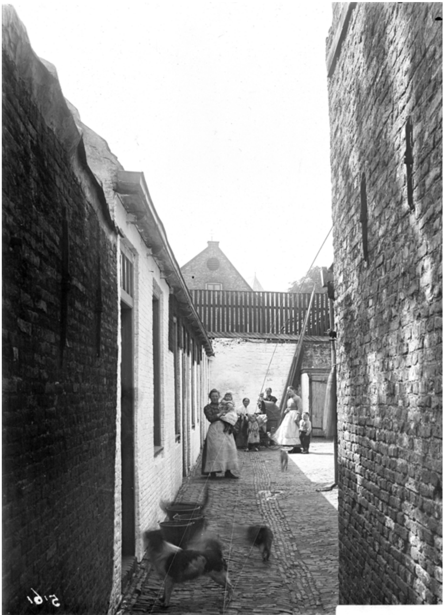
Rozenpoort, ca. 1900