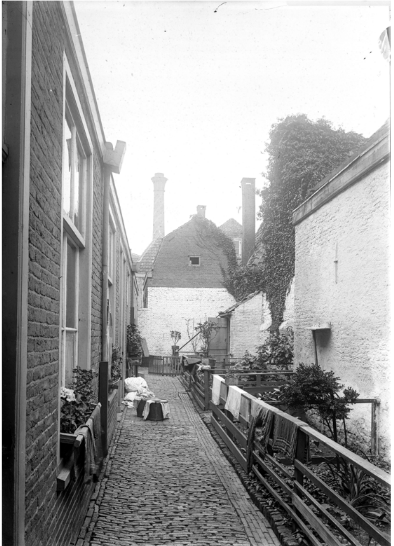
Willemspoort, ca. 1900