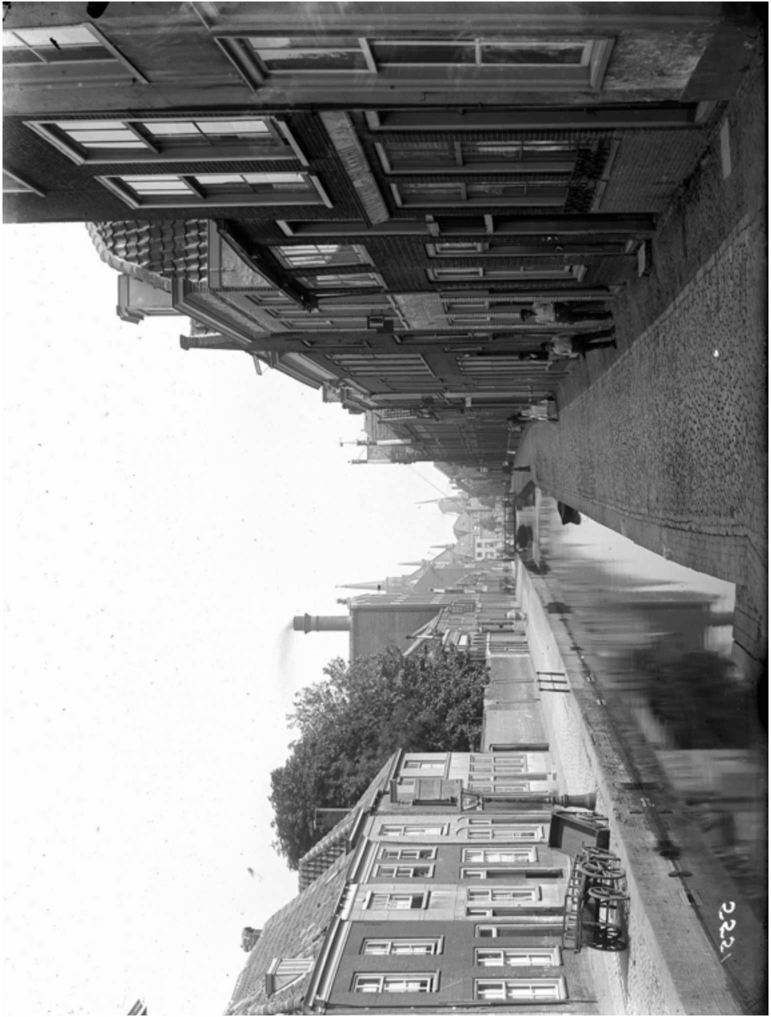
Middelstegracht, ca. 1900