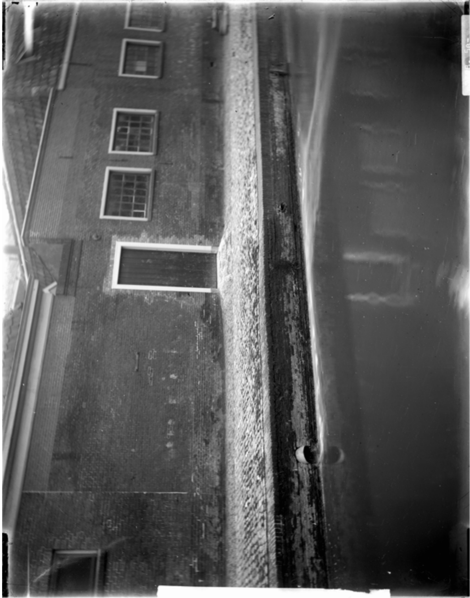
Uiterstegracht, ca. 1900