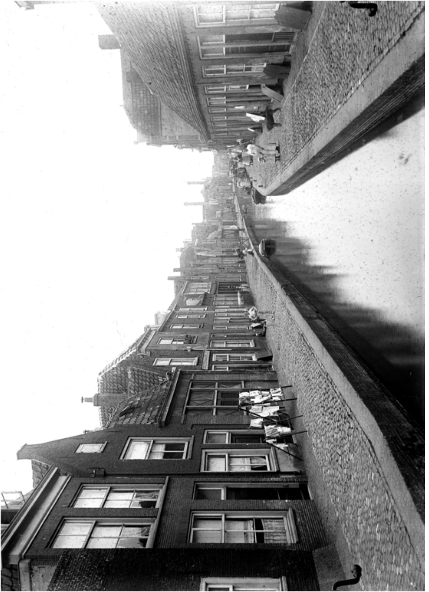
Uiterstegracht, ca. 1900